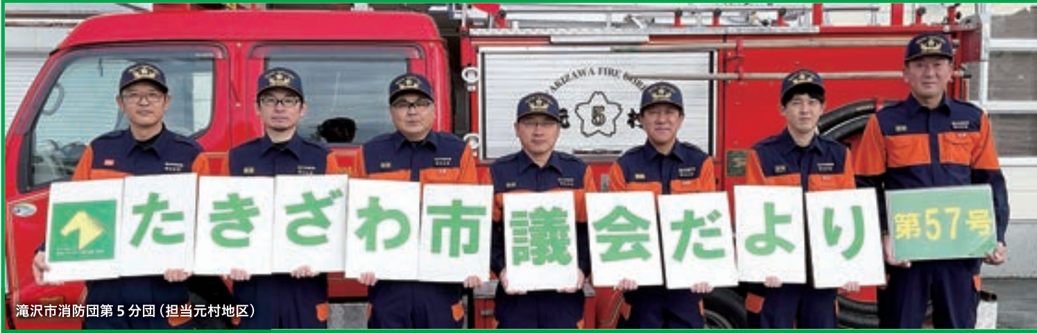
滝沢市消防団第5分団(担当元村地区)