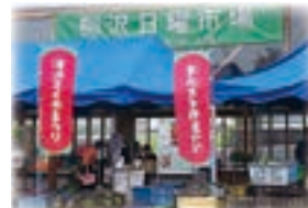
◀柳沢日曜市場 平成17年柳沢日曜市場としてスタート。柳沢地区コミセン隣で開催。