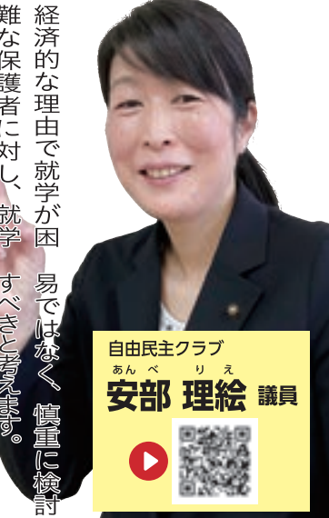
自由民主クラブ あんべ りえ 安部 理絵 議員

市教育委員会では、経済的な理由で就学が困難な保護者に対し、就学上必要な経費の一部を援助する就学援助制度を設けています。今後も経済的に困窮している世帯への援助を実施する考えです。