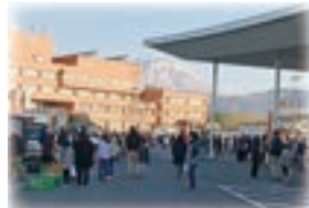
◀たきざわ日曜朝市 平成27年に始まり10年目。ビッグルーフ滝沢で開催。