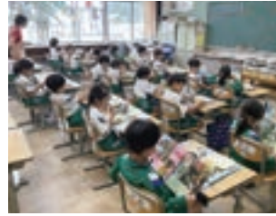
▲市内小学校の給食風景