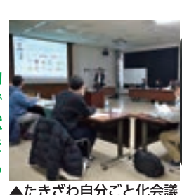
▲たきざわ自分ごと会議

予算の方針に対する具体的な答弁を引き出すことができませんでした。有害鳥獣対策では、現状での課題を明らかにして次につながる質問ができたと感じます。