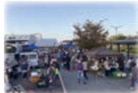
◀巣子日曜朝市 平成19年に葉の木沢山活動センターで始まり現在は巣子駅ロータリーで開催。