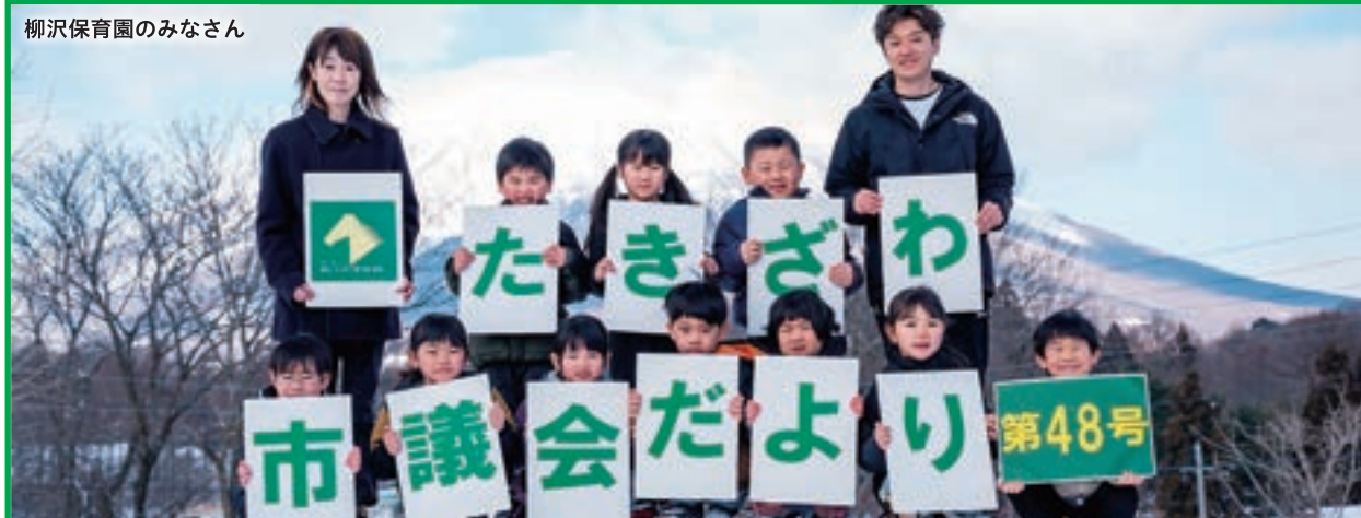
柳沢保育園のみなさん