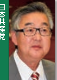
日本共産党 川口清之 議員