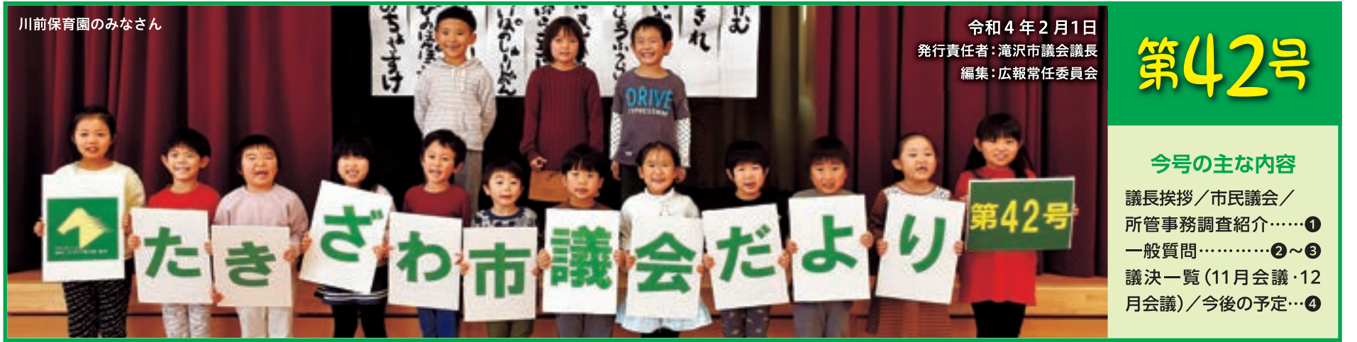
川前保育園のみなさん