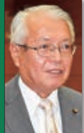
日本共産党 仲田孝行 議員