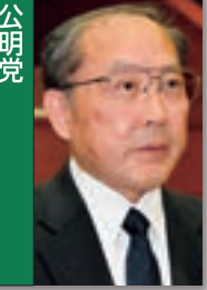
公明党 小田島清美 議員