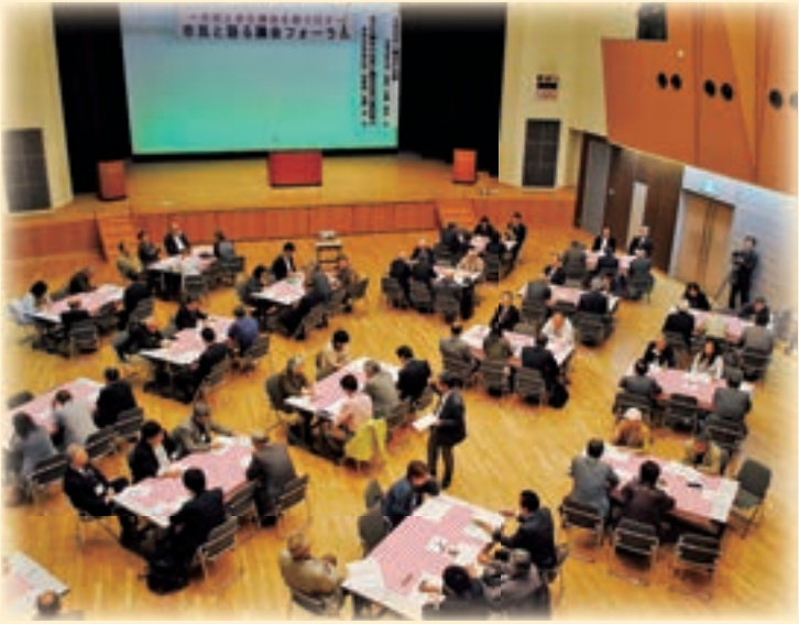
▲平成27年度の議会フォーラムの様子