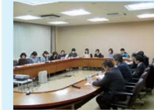
学童保育連絡協議会との懇談の様子

環境厚生常任委員会は、11月24日（金）19時から市役所の4階中会議室において、市学童保育連絡協議会の皆さまと「滝沢市内学童クラブの現状と今後の課題について」