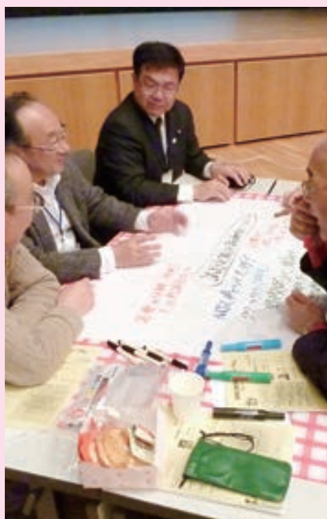
意見を模造紙に書き出しする参加者

ほいほいと口頭感じている思いがたたくと寄せられました。 テーマでは「議員の定数と報酬についてどう思うか」というテーマで話し合いました。「若い世代や女性議員の必要性」「投票率の低下問題」「議員活動量の増加」など、活発な意見が出されました。 また、ワールドカフェ方式の体験は初めての方が多く、今後も継続してほしいという声をたくさんいただきました。