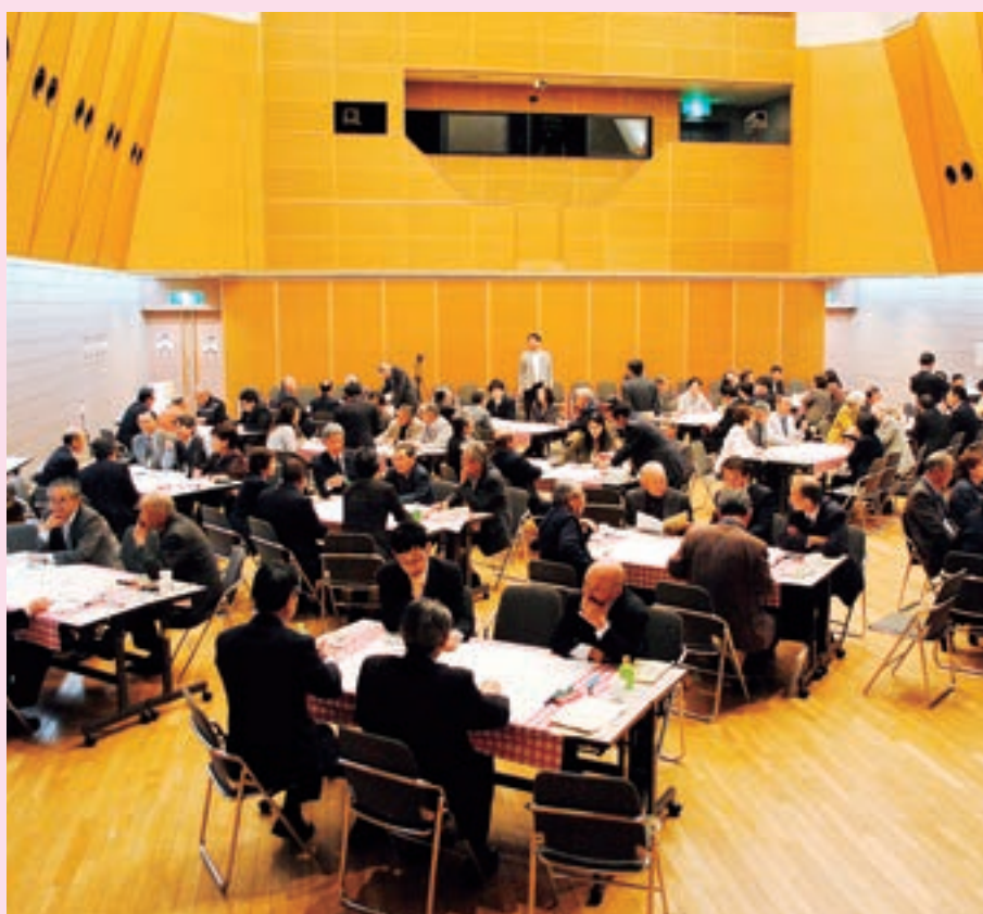
議会への期待など意見を交わす参加者と議員

滝沢市議会は4月19日、滝沢ふるさと交流館で議会が果たす役割や今後の課題について「市民と語る議会フォーラム」を開催しました。 フォーラムは、これまでの議会の活動や7月の市議会議員選挙に向け、情報などを広く市民の方々と共有するために、ワールドカフェ方式で行いました。市民100人が参加。議会について感じることや期待する点、チェックのクロスが敷かれ、カフェのような雰囲気の中で賑やかに開催されました。議員定数、議員報酬をテーマに20グループで議会の望ましい姿についてさまざまな意見が交わりました。 今後は、議会報告会や市民懇談会を開催し、さらに市民の意見を集約していく予定です。 議会に感じる点と期待すること 会場のテーブルにはチェックのクロスが敷かれ、カフェのような雰囲気で、意見を出しても結果を得られない、「市民の意見を聞く機会を多く設けて