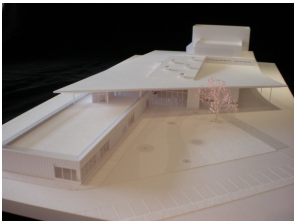
最終プランの模型