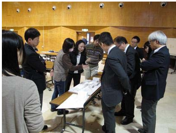
模型を見ながらあれこれ論議

また、多くの人から利用されることを踏まえて児童コーナーのイスは大人と子どもが使えるようにして欲しいといった備品に関する意見も出されました。