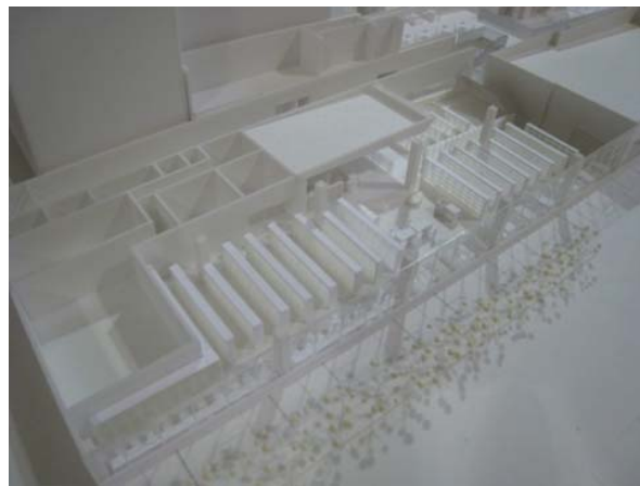
最終プランの模型(大屋根を外した状態、図書館周辺)