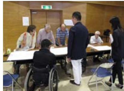
バリアフリー意見聴取会で提案を