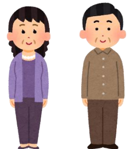
民生児童委員のみなさん