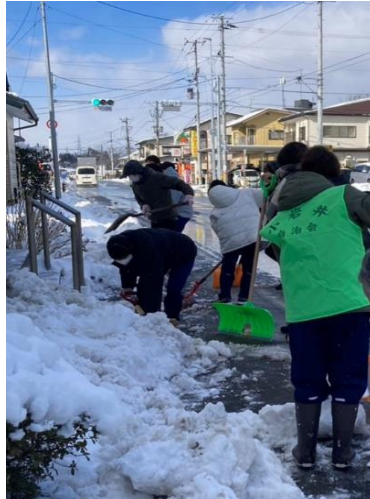
少しだけですが雪かきもできました