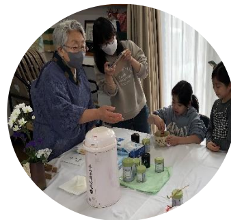
抹茶のおいしい点て方も教えていただきました

もちつきに合わせて抹茶体験会も行われました。茶道に心得のある地域の4人の皆さんがボランティアで協力。日頃体験することの少ない抹茶を提供。子供たちは茶道の作法を教わりながら神妙な面持ちでいただけていました。ボランティアの皆さん、ありがとうございました。