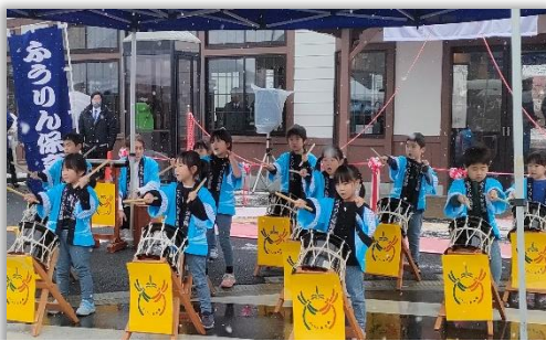
園児たちが元気良く「ふうりん太鼓」を演奏