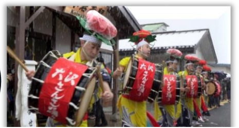
大沢さんさ踊りの皆さんが踊りを披露、リニューアルオープンに華を添えてくれました