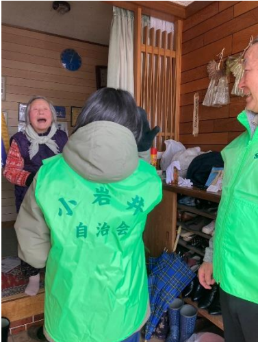
訪問先ではとても喜んでくれました