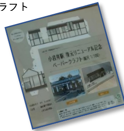
上 記念品を配布される参加者 下 記念品の小岩井駅のペーパー クラフト