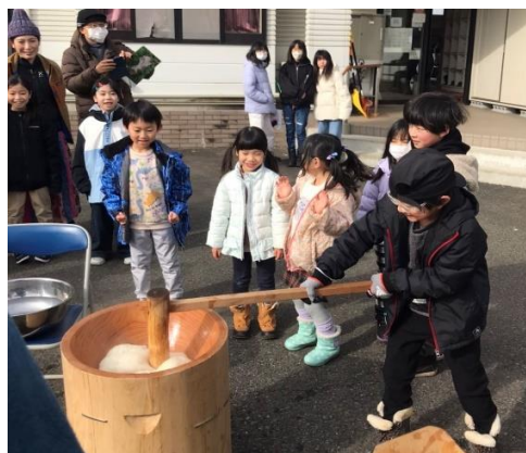
もちつきって楽しいな