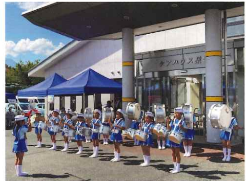
巣子保育園 マーチングバンド