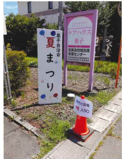
手作りの看板で歓迎