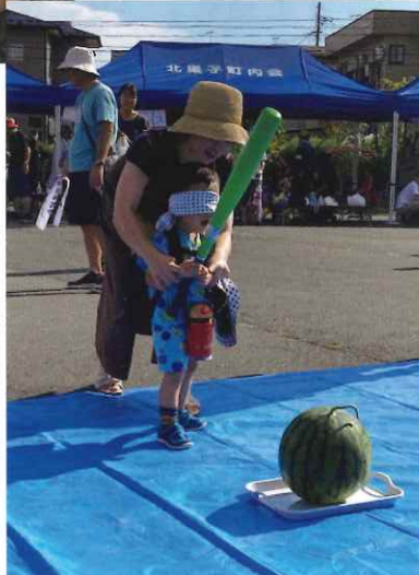
夏祭り すいか割り