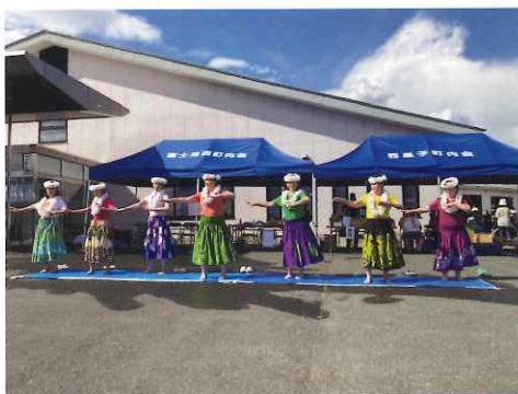
プルメリアで華やかさを添えて