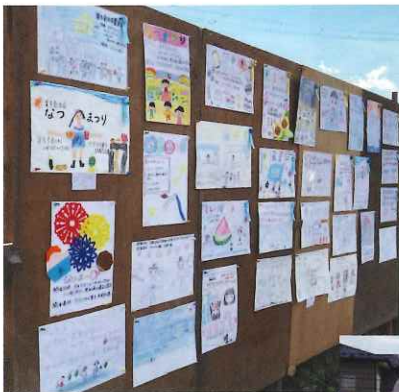
夏祭りポスター コンテストの作品