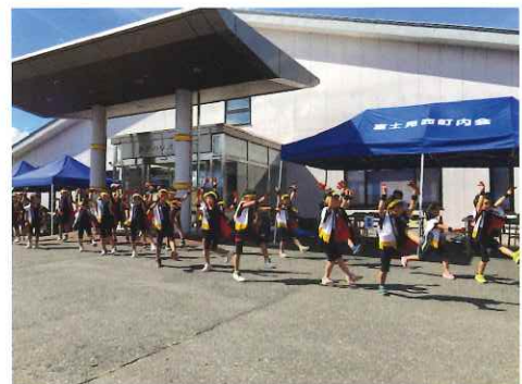
南巣子保育園 よさこい踊り