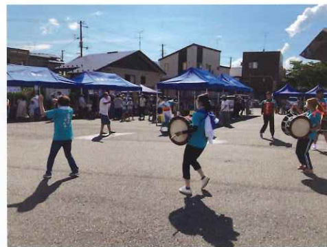
さんさ踊りで暑さをふっ飛ばして