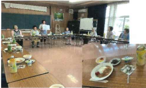
手づくりはやっぱり違うね～ 保健部の皆さんも力を入れました

5年振りの手づくり昼食会が7月1日、行われました。センター内はカレーの匂いでいっぱい。「パタカラ体操」後みんなで会食。「おいしいね、おいしいね」の連発でした。