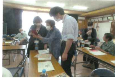
これはどうするの？丁寧に教えてくれました