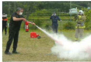
燃えている炎の消火開始