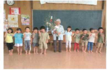
元気いっぱいよさこいソーラン、皆さん元気で長生きして下さいね