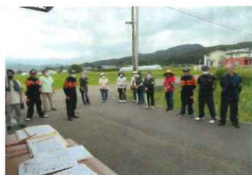
5班に分かれて巡回パトロール開始