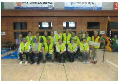
今日は入ったなあ 応援組も選手組も楽しく!!