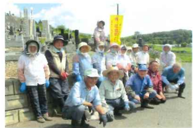
今日は奉仕の日です