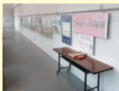
パネル展の様子(ビッグルーフ滝沢:ギャラリー)

市が設置した下水道本管や公共汚水ますに異常がある場合は、使用者の原因でなければ市が修繕を行います。異常を発見した場合は施設課(下水道担当)にご連絡ください。