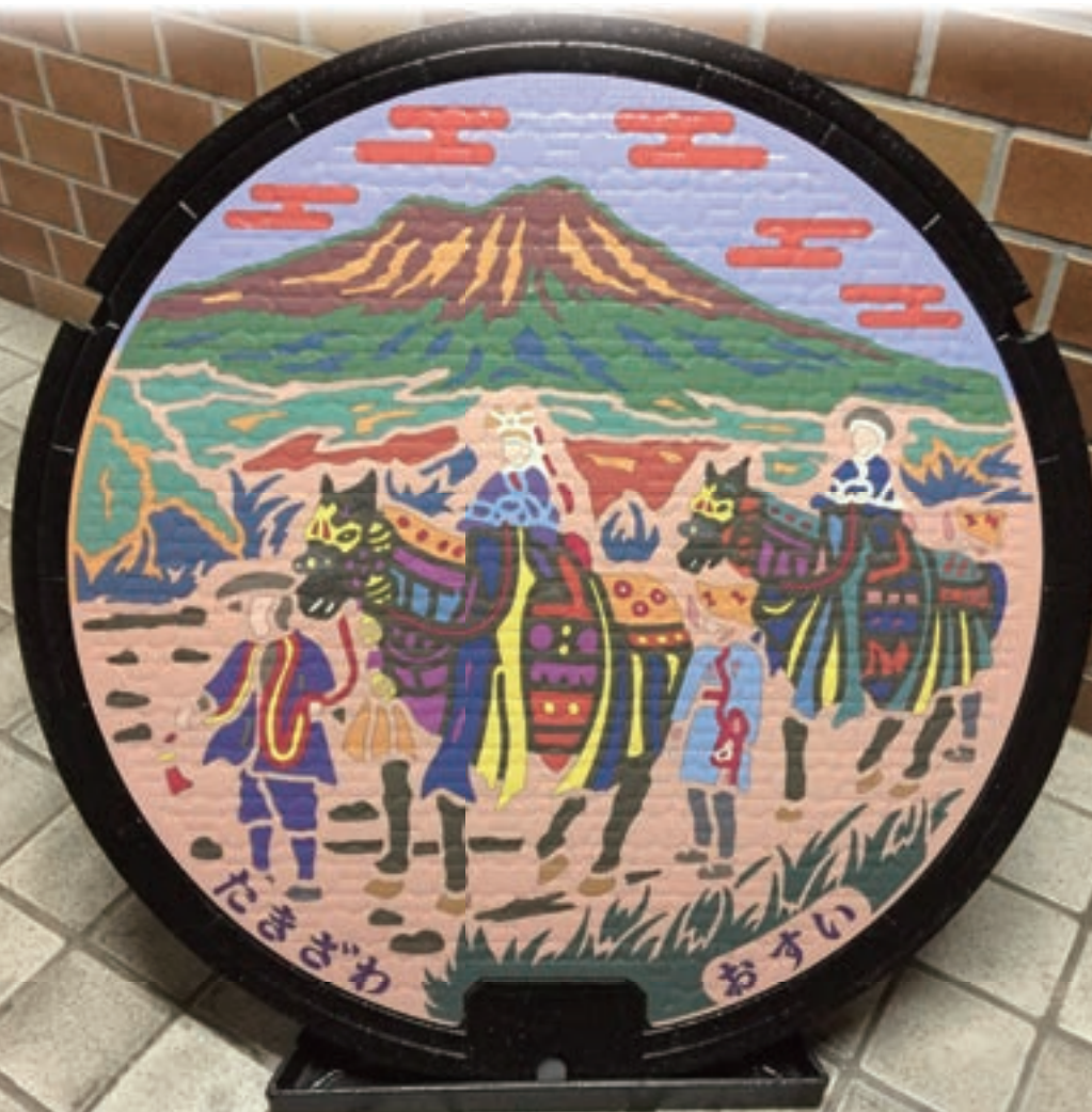
写真:滝沢市の汚水マンホール。チャグチャグ馬コの行進の様子がカラフルに描かれています。