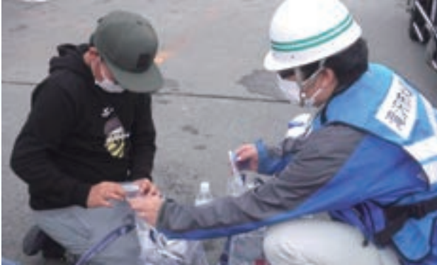
給水袋の使用体験

ホームページ https://www.city.takizawa.iwate.jp Eメール ryoukin@city.takizawa.iwate.jp