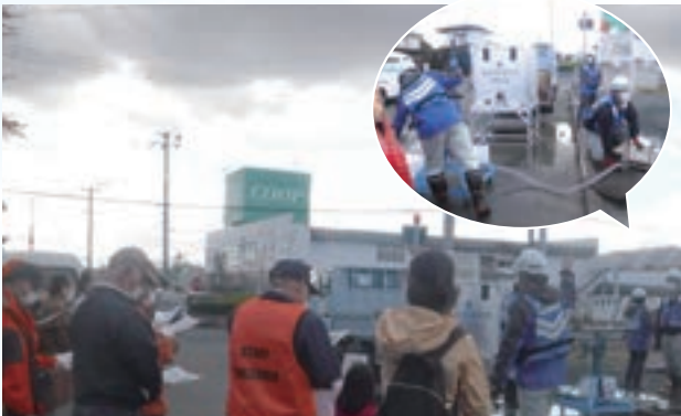
訓練についての説明