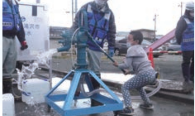
手動ポンプでの給水体験