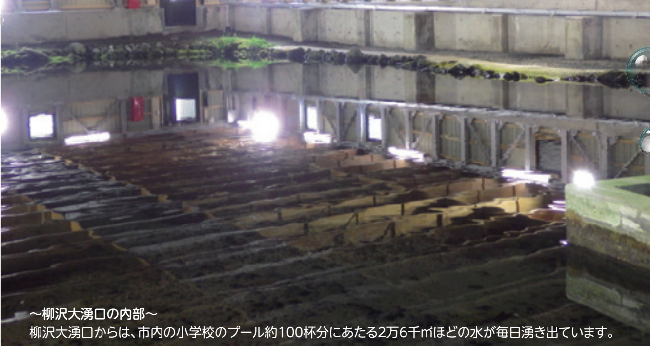
～柳沢大湧口の内部～ 柳沢大湧口からは、市内の小学校のプール約100杯分にあたる2万6千m 3 ほどの水が毎日湧き出ています。

平成30年6月2日(土)、市内の水道施設等をめぐる『滝沢浄水場と岩手山麓湧水地めぐり』を開催しました。(関連記事4ページ)。