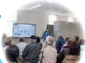
熱心に聴く皆さん (滝沢浄水場)

参加した20名の皆さんは、浄水場職員の説明を熱心に聴き入り、活発な質疑応答も繰り広げられました。岩手山浄水場では、タンクの上に登っていただきましたが、その高さに驚かれる方、大湧口で水の湧き出る様子を沢山の質問を交えながら熱心に観察される方など、皆さん思い思いに充実した見学会を過ごされたようです。「滝沢は本当に水が豊か」「水を大切に管理している」等、あたたかい感想を下された参加者の皆さん、本当にありがとうございました！