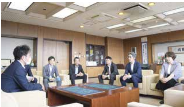
被災地の状況を市長らに報告する柳田主任