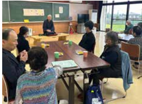
▲おしゃべりしながら交通安全に関する落語を聞き、知識を深める

物を実施しています。今後とも要望を取り入れながら誰でも参加できる「居場所ほっこり」を開催していきます。