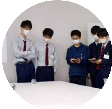
▲高校生を対象にしたロボットプログラミング講座

市IPUイノベーションセンターと同パークに集積したIT企業群の技術力を生かし、県立大学と連携したIT人材育成事業などの実施により、不足するIT人材の育成、課題解決、地域産業の発展を図ることを目的に活動しています。