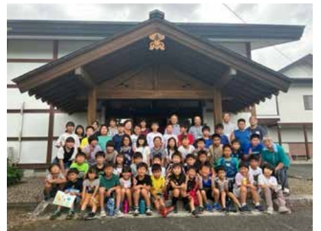
▲篠木地区の子どもたちと、みんなで昔遊び

「居場所ほっこり」は月2回ビッグルーム滝沢や市多目的研修センターなどで開催しています。参加者からの要望に合わせて、カラオケやポッチャ、紙芝居の読み聞かせ、編み物などの催し