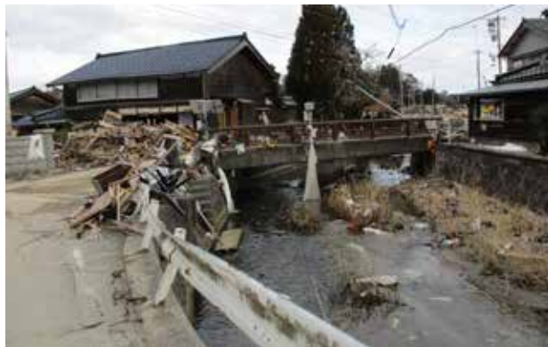
1月下旬の石川県能登町内の様子