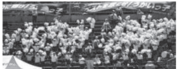
選手を支える陣地での応援