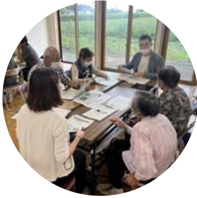
▲柳沢地域での地域内交通のあり方に関するワークショップ

複数業種の関係者から成り、地域課題解決に向けたサポートを行っています。また、RabbitPeccaシステム（公共交通の乗降管理）がきっかけで、令和5年から「あいおいニッセイ同和損害保険株式会社」との取り組みがスタートしました。