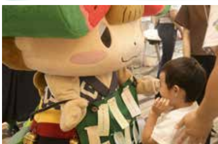
願い事を書いた短冊をちゃぐぼんのエプロンにつける子どもたち

■七夕の日には開催されたほしまつりは、県立大学のサークルによるステージ発表などもあり、大いに盛り上がりました。遊びに来ていたちゃぐぼんのエプロンに「ぶりんせすになりたい」など思いの願い事を書いた短冊を子どもたちがたくさんつけていて、ちゃぐぼんもとても嬉しそうでした。（阿部）