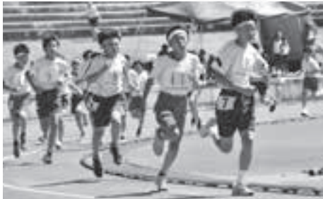
6年男子 800 m