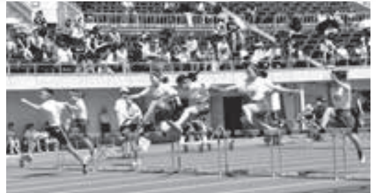
6年女子 80m ハードル

第76回滝沢市小学校陸上競技記録会が7月2日（火）、純情産地いわてトラフィール（県営運動公園陸上競技場）で開催されました。