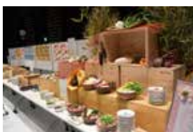
◀市産の食材を ふんだんに使用 した、鮮やかな 料理

■特集のコンサートを取材してきました 。オーケストラの皆さんは叶さんと 国府さんとご一緒するのは初めてとの ことでしたが、国府さんが奏者の一人 一人を和やかに紹介されていて、ほっ こり。そして生演奏は迫力が違うなあ と思いました！お客さんもいい表情を していて、皆さんと素敵な時間を共有 できたことに感謝です。(角掛)