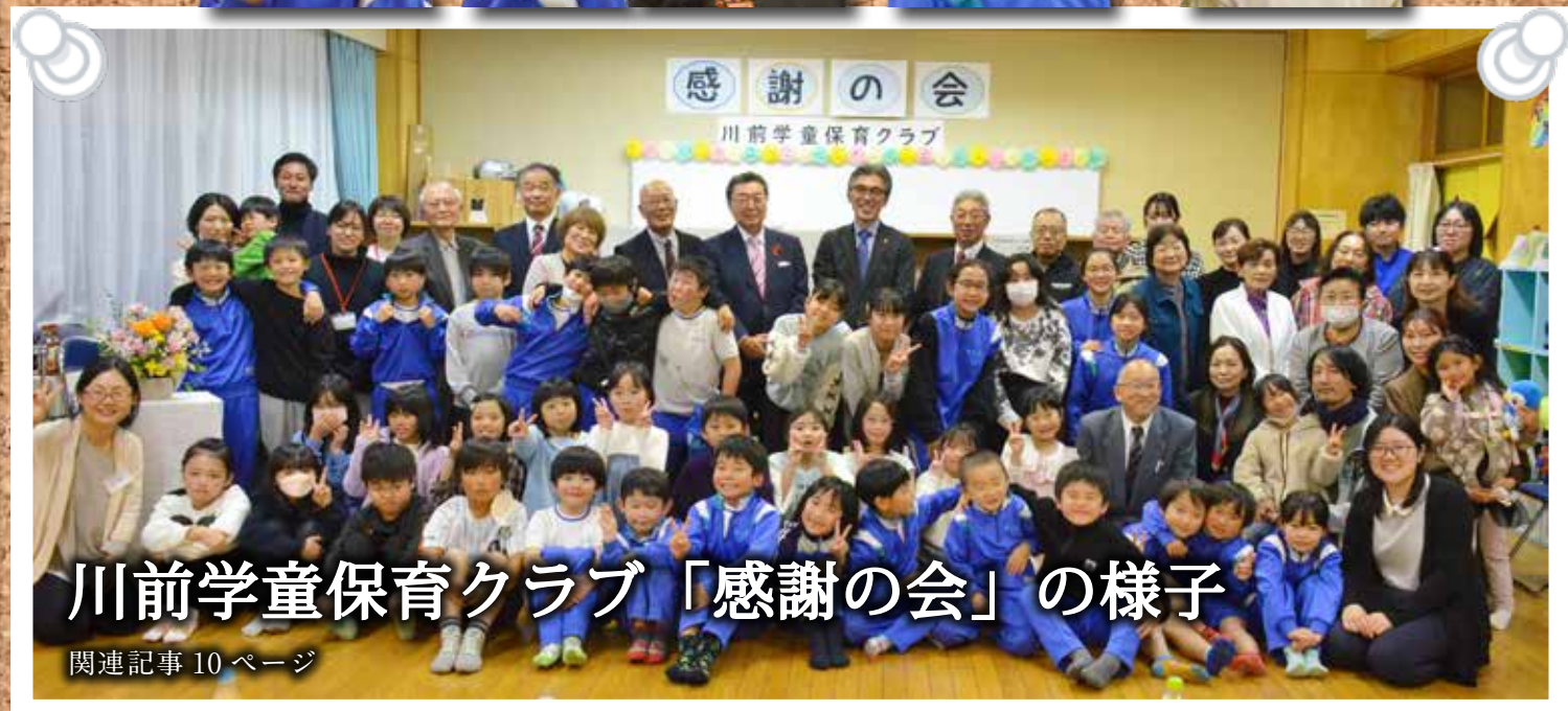
川前学童保育クラブ「感謝の会」の様子