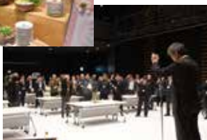
▶生産者と事業 者が参加