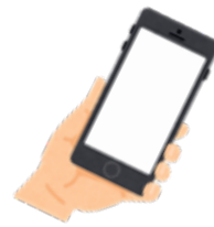
マイナンバーカード 読み取り対応の スマートフォン