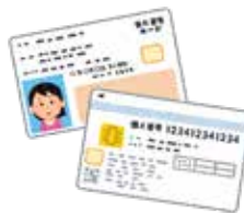
マイナンバーカード