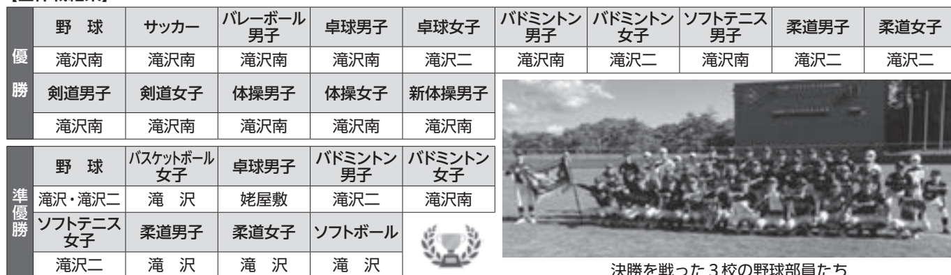
決勝を戦った3校の野球部員たち