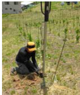
▲つるをくりつけるための垣根づくり

経歴：滋賀県のワイナリーで8年ほどワイン醸造に従事した後、東京都に拠点を移し、山梨県などでブドウ栽培やワイン製造の知識を深める。