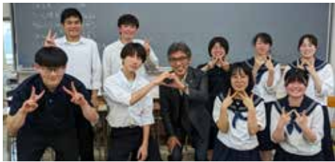
◀盛岡北高生との市長と話そう (6月15日)