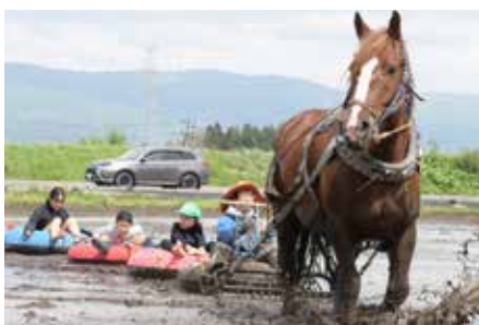
▲チャグ馬農耕馬による「泥チューブ」体験