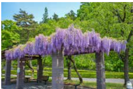
▲滝沢総合公園で満開の藤の花

■コロナが5類感染症に移行し、取材にお招きいただくが増えました。完全にコロナ流行前の状態とはいきませんが、市内の活気が戻ってきたようで、うれしく思いながら取材しています。当たり前の日常を当たり前と思わず、大切にしていきたいです。(森内)