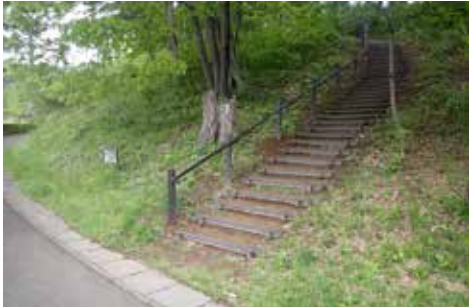
▲整備した階段・手すり