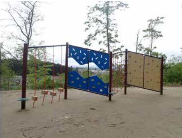
▲クライミング遊具