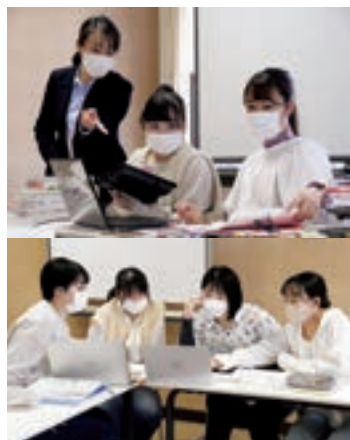
課題解決策を検討中