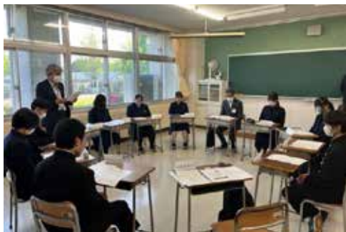
▲盛岡農業高校での「市長と話そう」

第2次滝沢市総合計画については、令和5年度開始の予定を見直し、令和6年度からのスタートに向けて現在策定事務を進めています。 第2次滝沢市総合計画は、総合計画の期間内に滝沢地域が「やさしさに包まれたまち」になるよう、市民の皆さんと行政がそれぞれの役割の中で地域づくりを進めていくことを目指す計画です。