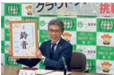
▲ 10 月 5 日に開催した定例記者会見で「鈴音」の名前を発表する武田市長

■チャグチャグ馬コは、かつて農業で重要な役割を担っていた馬の無病息災を願い、農家の人々が「蒼然神」にお参りしたことが始まりです。時代の変遷とともにその数が減少傾向にある馬コ。滝沢が誇る伝統行事を守るため、近年は「チャグチャグスイカ」なども含め、多様な形で支援の輪が広がっています（石井）