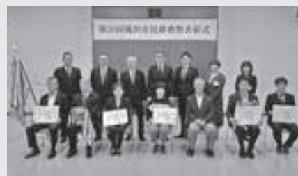
表彰式に出席した皆さん