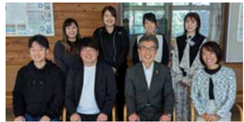
▲NPO法人 Future Seedsの皆さんとの市長と話そう(10月11日)