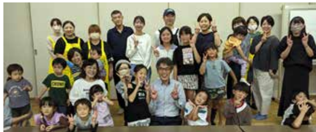
▲NPOモグモグに関わる皆さんとの市長と話そう(9月22日)