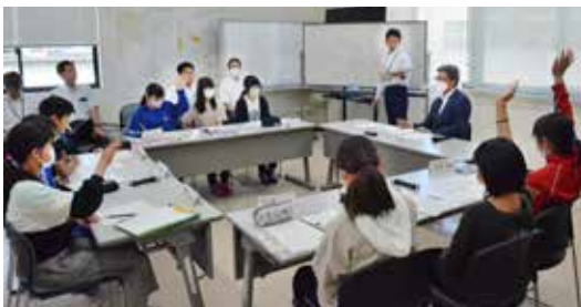
▲市内小学生の皆さんからも意見をもらいました。

現在の市の取り組みなどの進捗状況や、第2次滝沢市総合計画で設定する指標の基準値を測定することなどを目的として、現在、市内3200人を対象とした幸福実感アンケート調査を実施中（回答期限：11月20日）です。市政を推進するため大切な基礎資料となるので、アンケート用紙が届いた皆さんは、回答への協力をお願いします。