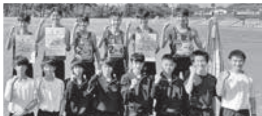
全国大会を決めた滝沢南中男子特設駅伝部