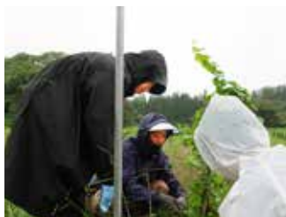
▲作業内容を説明する様子

経歴：滋賀県のワイナリーで8年ほどワイン醸造に従事した後、東京都に拠点を移し、山梨県などでブドウ栽培やワイン製造の知識を深める。