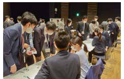
▲計画作成のために SDGs について学ぶ職員

さて、今年4月から、第1次滝沢市総合計画後期基本計画の最終年度が始まります。掲げられた目標を達成するよう最大限の努力をすべく、令和5年度から始まる新しい総合計画の策定をしっかりと進めて参ります。また、これら推進のためには、市民、議会、行政が力を合わせて進めることが重要と考えております。