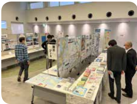
▲全国バスマップや交通事業者などの情報を発信した展示ブース

後半では、さまざまな取り組みをしている北上市、岩手県交通(株)、岩手県北自動車(株)の交通事業者などを交え「公共交通の現実と向き合う」と題したパネルディスカッションが実施されました。 人口減少やマイカー依存、運転手不足やコロナ禍で全国的に公共交通が衰退し、特に地方部では崩壊寸前の状況となっています。一方で、地域公共交通は住民の生活の足となる重要な役割を担っており、超高齢社会の進展により、今後さらなる需要の増加も想定されます。 今回のサミットを通じ、岩手県の公共交通の今後の在り方などを考えるきっかけとなりました。