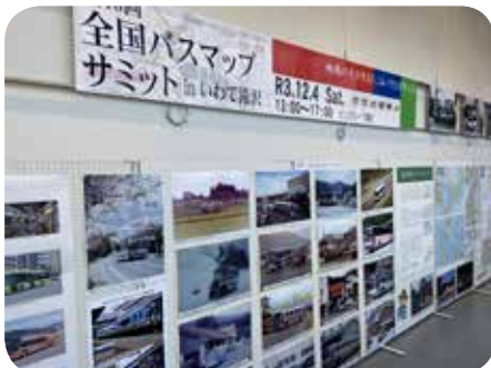
▲岩手のバスの歴史や写真などが飾られたギャラリー