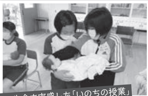
自分の生命を実感した「いのちの授業」

自他の生命を大切にすることを狙いに、本年度もいのちの授業を実施しました。子どもたちは、小さな命が成長していく様子画像を見たり、本物の赤ちゃんと同じ重さと大きさの人形を抱っこしたりして、命の大切さを学びました。