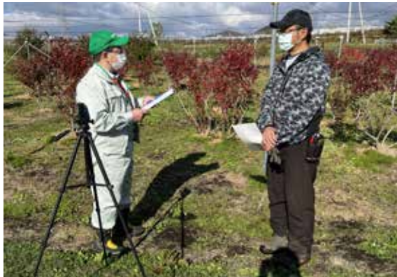
▲新規就農者との面談風景

今年はコロナ禍のため、10月27、29の両日に農地小委員会の委員2人が実施しました。動画撮影をしながら聞き取りを実施し、委員全員で情報共有しアドバイスをしました。農業に関心のある人や農業を始めたい人は農業委員会事務局に相談してください。