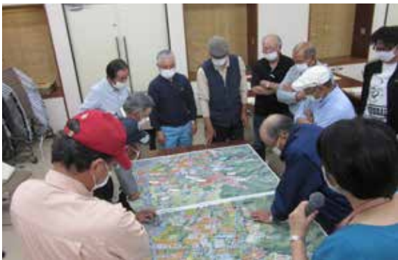
▲篠木地区の話し合いの様子

本年度篠木地区では、地域ぐるみで農地集積に取り組みました。現在、地区内の農地面積の約70%がこの事業を活用しています。地域でまとめて活用することで、農地の集約化と担い手の効率的な営農が可能になります。この制度の活用を希望する地域は、農林課か農業委員会事務局へ問い合わせください。