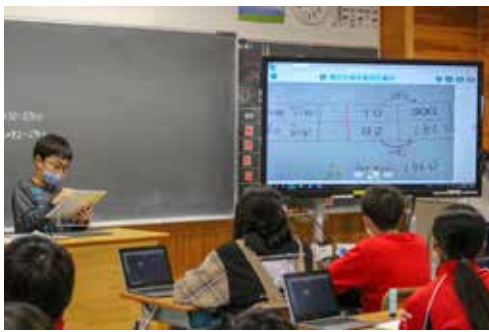
▲タブレットを使用した授業風景

また、現在、市内の主要施設と市役所にテレビ会議システムの導入を進めております。コロナ禍においても各地域の活動拠点がつながり、会議や