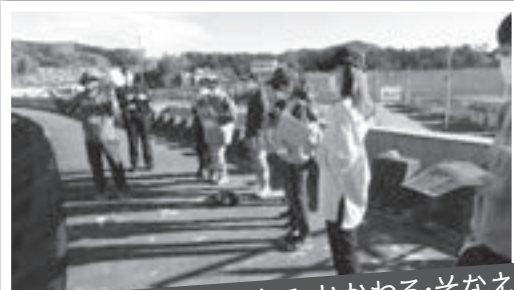
いわての復興教育 いきる・かかわる・そなえる ～大震災の爪痕から学ぶ～

修学旅行で宮古市田老を訪れ、万里の長城と呼ばれた防波堤が壊れた跡を見学しました。子どもたちは、自然の威力のすさまじさを感じるとともに、自分の命を守るためにはどう行動すればよいのか、一人一人が真剣に考えました。