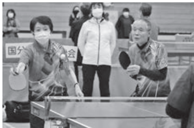
年間総合成績1位に輝いた 長根自治会の選手