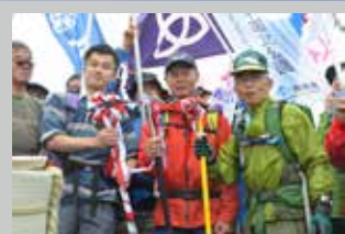
山頂でピッケルを交換し、 3市町の親睦を深めます。