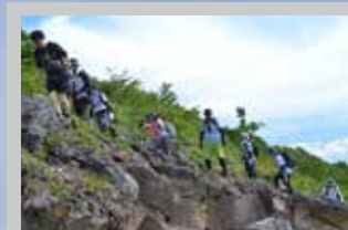
森林の中を歩く新道と開けた ガレ場の旧道に分かれる。2.5 合目に分岐があり、その後も 所々、連絡道で行き来できる。