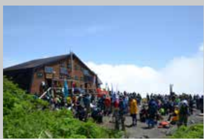
約100人を収容できる八合目避難小屋。目 の前の湧水「御成清水(おなりしみず)」で 喉を潤すこともできる。水枯れには要注意。

滝沢市と八幡平市、栗石町の3つの 登山口で、登山者の安全祈願と山開 き式を開催します。終了後は一斉に 登山を開始。3市町がおのこの旗 を掲げて頂上を目指します。