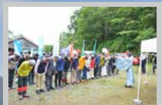
各登山口で午前6時から安全 祈願と山開き式が開催される。