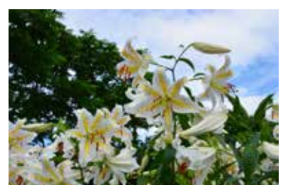
◀見頃の市の花ヤマユリ

▶申し込み・問い合わせ/8月22日(月)午後5時までに、盛岡税務署法人課税第一部門(☎622-6237)へ申し込みください。