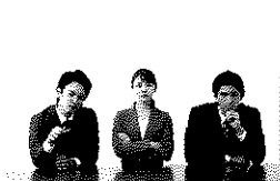
従業員が障がい特性を 理解するにはどうしたら?