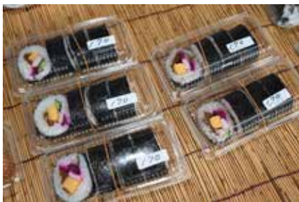
▲雑穀を使用した太巻きも人気です。