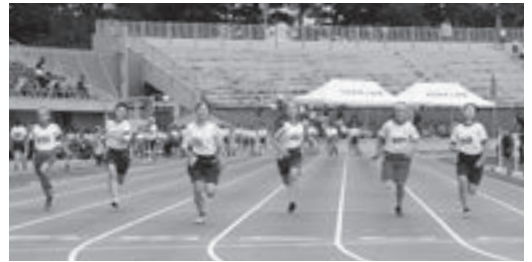
ゴールに駆け込む選手たち

第73回滝沢市小学校陸上競技記録会が7月8日、県営運動公園陸上競技場で開催されました。