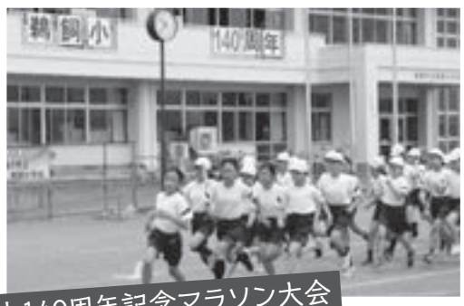
創立140周年記念マラソン大会

マラソン大会が6月第3週の学年マラソンウィークに開催されました。子どもたちは、友達や保護者の皆さんの応援や拍手を受け、目標をもって最後まで走り抜きました。この経験と達成感は、今後の活動に生きてくるはずです。