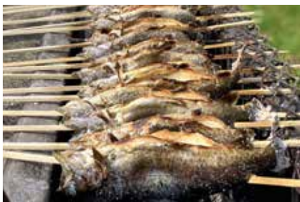
炭火で40分じっくりと焼かれるニジマス

市内に施設があるテンパーク（国立岩手山青少年交流の家）と滝沢市がYouTubeでコラボ企画をしています。コラボ第一弾は、行徳養魚場で釣り対決。ニジマスで10匹先に釣り上げたほうが勝ちというルールで、勝ったのは、滝沢市チームでした。テンパークのYouTubeチャンネルに動画がありますので、ぜひご覧ください。コラボ第二弾は、8月13日（金）に動画がアップされる予定です。皆さん第二弾もどうぞ楽しみにしてください。 テンパークでは、YouTubeやInstagramで体験活動の魅力を発信しています。登山やキャンプ、野外活動の動画など、ぜひご覧ください。