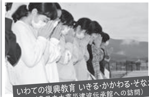
いわての復興教育 いきる・かかわる・そなえる (東日本大震災津波伝承館への訪問)

昨年度の修学旅行で、陸前高田市の東日本大震災津波伝承館を訪れました。子どもたちは、津波を経験した校長先生やPTA会長の話を真剣な表情で聞き、「ここで学んだことを忘れない」と、心に深く刻みました。