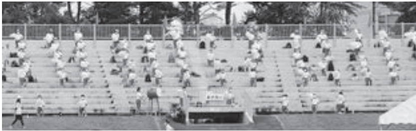
工夫を凝らした応援をする児童