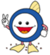
下水道キャラクター スイスイ

なお、水洗便所へ改造する費用は、融資あっせん利子補給制度の対象となります。詳細は、排水設備指定工事店から下水道課へ相談してください。