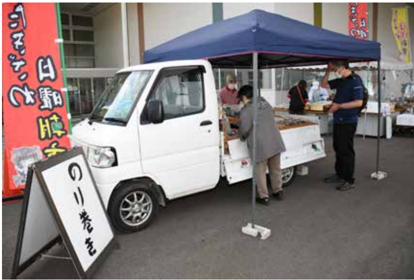
▲大きな看板が目印。細巻きが食べたい人は早めにお越しください。