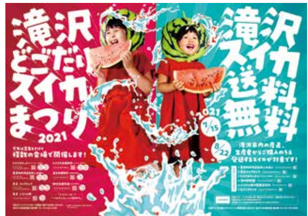
【表1】滝沢スイカを贈ろうキャンペーン・滝沢どごだりスイカまつり実施一覧表

市内のスイカ生産者は今年もおいしいスイカを皆さまにお届けしようと手間暇を掛けて栽培しています。コロナ禍の今こそ、たくさんの人にスイカを食べてほしいという思いから、「滝沢スイカを贈ろうキャンペーン」を始めました。8月22日(日)までに、市内産直や一部の生産者から購入したスイカを発送する際、送料が無料になります。知り合いの皆さんに、滝沢スイカと元気を贈りましょう。