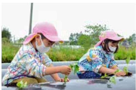
声を掛けながらサツマイモの苗を植える保育園児

市の特産品「滝沢スイカ」を利用した「滝沢スイカゼリー」が新発売されました。この商品には、季節限定のスイカをお土産としていつでも味わえるようにという市の思いが込められています。凍らせてシャーベットにしてもおいしく食べられるこのスイカゼリーは、5個入り1296円(税込)で販売しています。4月28日にはビッググループ滝沢で先行販売会が実施され、買い物に訪れていた人たちは、興味津々に商品を手に取っていました。この日はたきざわキッチンでランチを注文した人たちに無料で振る舞われ、皆さん笑顔で堪能していました。滝沢スイカゼリーは、現在ビッググループ滝沢やマイヤ、いわて生協などで、数量限定で販売しています。ゆくゆくは常時販売していく予定です。滝沢市のお土産にぜひ一度利用してみてください。