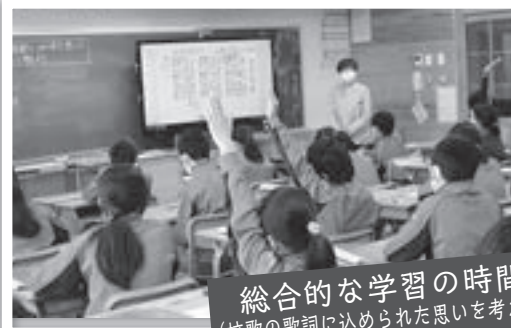
総合的な学習の時間 (校歌の歌詞に込められた思いを考える)

6年生では「歌とさんさで心をつなぐ滝沢中央小学校」をテーマに、校歌の歌詞に込められている思いや願いについて考える授業を実施しました。歌詞の意味を考えながら心を込めて校歌を歌おうという気持ちを育てることができました。