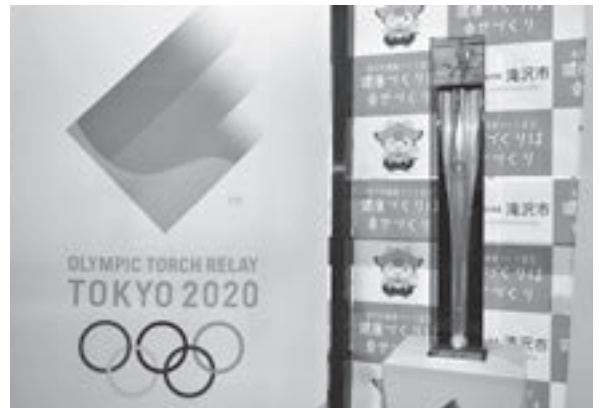
昨年の聖火リレートーチ巡回展示の様子