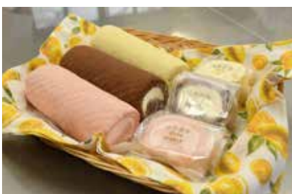
▲ゆくゆくはビッグルーフ滝沢や、らら・いわてなどでも販売予定です。

みのりホーム 滝沢市菓子 148 - 28 ☎ 694 - 3003 受付時間／平日 午前8時半～午後5時15分