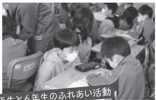
1年生と6年生のふれあい活動

市内の全小中学校における手洗い場の全ての蛇口を、これまでの回転式からレバー式へ順次交換していきます。蛇口に直接手を触れることなく肘でレバーを押すだけで水が出るため、感染リスクの軽減につながります。なお、トイレの流し場も自動水洗化されます。