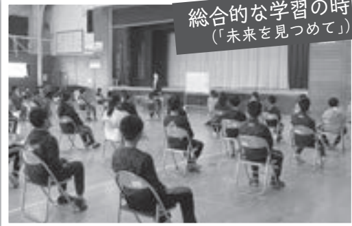
総合的な学習の時間 （「未来を見つめて」）

6年生は、キャリア教育の一環として「未来を見つめて」をテーマに4月からの中学校生活への心構えについて学習しました。講師に滝沢第二中学校の先生を招いて、卒業までに頑張してほしいことや中学校生活で大切にしてほしいことなどについて説明を受け、中学校生活への意欲を高めました。