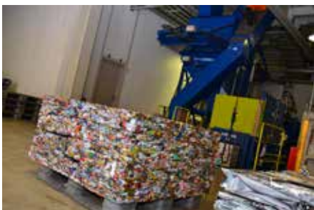
圧縮されて金属としてリサイクルされる缶

■今回取材させていただいたそば道場さんは、店員、お客さんどちらも笑顔が絶えないすてきなお店でした。滝沢には他にも、このようなアットホームな飲食店がたくさんあり、コロナに負けずに頑張っています。皆さんで食べに行くことで応援しましょう！(菅原)