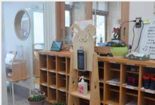
▲おが～の独自のサーモカメラスタンド。