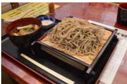
▲人気の「鴨せいろ（税込み 1100 円）」 試食会員になると 1050 円で食べられます。