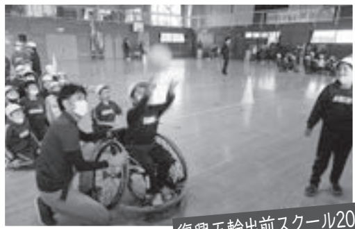
復興五輪出前スクール2020

パラスポーツ体験（岩手県文化スポーツ部オリンピック・パラリンピック推進室事業）を11月4日に行いました。