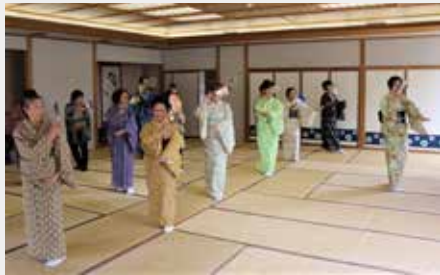
教養講座と多彩な 29 教室を開催します 皆さんの参加をお待ちしています

令和3年度の滝沢市睦大学 受講生を募集しています。趣 味や学習を通して、仲間の輪 を広げてみませんか。