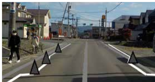
▲カラーコーン設置