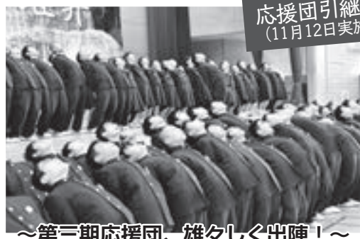
応援団引継式 (11月12日実施)

児童生徒が安全安心に学校生活を送れるよう、今後はトイレの洋式化、放送設備の改修などを計画的に進めていく予定です。