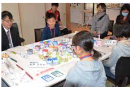
「医療費助成は子どもが多い今すべき事業ではない」などと大人顔負けの議論を展開する子どもたち

■キッズニアを取材 (P10)。市役所ブースでは、子どもらが部長になり、除雪や医療費助成などの事業に対し、限られた財源を配分。結果を議員役の職員に説明しました。市民のためどの事業を取捨選択するか、議会や市民にどう説明するか頭を悩ませました。(菅野)