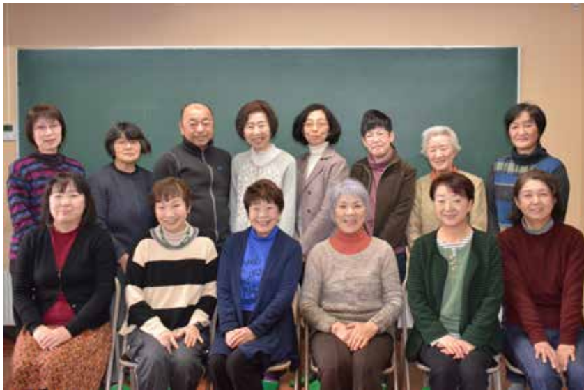
会員同士の関わりや子どもとの触れ合いも楽しみながら続けている皆さん。

「こだま」は、視覚障がい者や、高齢で文字が読みづらい人のために「広報たきざわ」などの録音版を作成しています。他にも市内の小学校やお祭りで大型紙芝居や絵本の読み聞かせをするなど、幅広く活動しています。録音に関する研修を受講したり、月に1度例会を開き全員で反省点などを討論。正しく分かりやすい朗読を目指し、録音に手は抜きません。そのモチベーションの秘訣は「障がいの有無にかかわらず誰もが平等に情報を得られるようにしたい」という共通の熱い思い。常に自分も情報を発信する一員だという自覚を持ち、研究と努力を重ねた朗読は、聞く人の心を動かします。