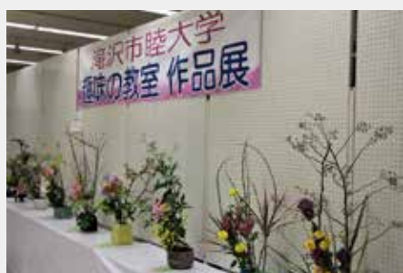
教養講座と多彩な 29 教室を開催します 皆さんの参加をお待ちしています

令和2年度の滝沢市睦大学 受講生を募集しています。趣 味や学習を通して、仲間の輪 を広げてみませんか。 ●対象 市内にお住まいのおおむね 60歳以上の人で、自分で講座 に通うことができる人 ●学習内容 ①教養講座 日常生活で広く役に立つ知 識や教養を身に付けるための 講座です。 ②趣味の教室 下表「趣味の教室講座一覧」 の29教室を開催します。 ※申し込み人数が少ない教室 は開催しない場合があります。