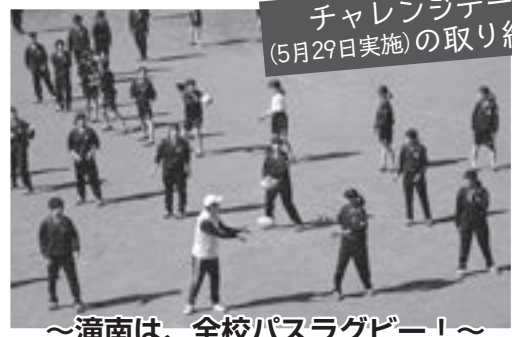
チャレンジデー (5月29日実施)の取り組み