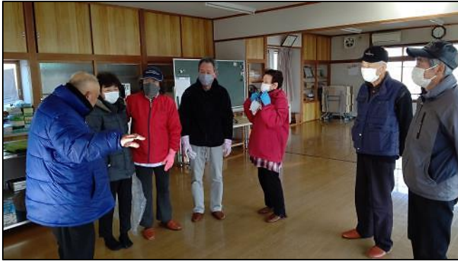
始めに段取りを説明。