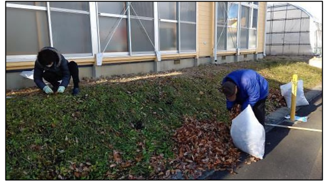
会館脇の落葉の清掃。