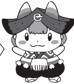
滝沢市ご当地キャラクター「ちやくぼん」