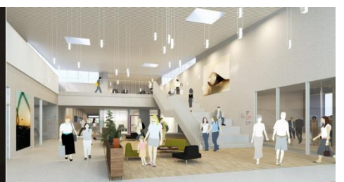
ふれあい広場イメージ