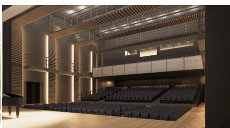
大ホール～客席イメージ