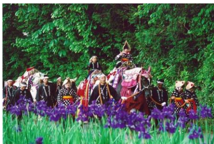
チャグチャグ馬コ

私たちの地域には、自然・歴史・文化に育まれた伝統芸能・食文化・景観・自然環境など、みんなで守り育て、次の世代に継承したい宝物があります。