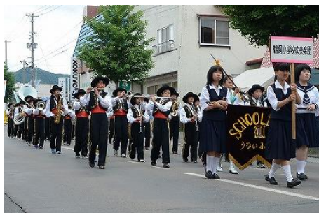
鵜飼小学校吹奏楽