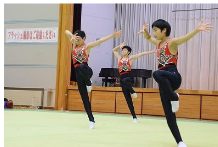
滝沢南中学校新体操