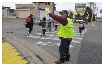
地域の子供達とスクールガード