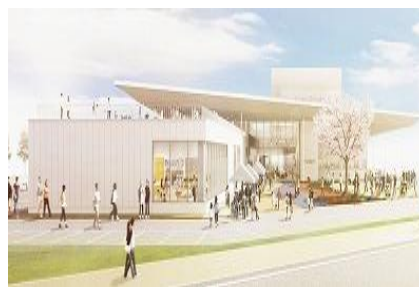
交流拠点複合施設