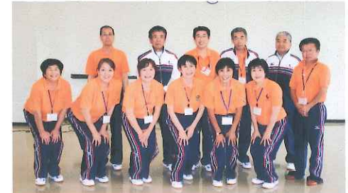
スポーツ推進委員です、よろしく。