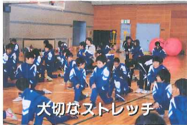
大切なストレッチ

私たち滝沢村スポーツ推進委員は、村民の健康・体力増進のために、ニュースポーツを中心とした紹介及び、指導を行っています。 主な種目は、ドッチビー・キンボール・5色綱引き・ユニホック・ディスクゴルフ・ペアリングキャッチ・スローイングイベントボード・ダンベル体操・エアロビ・スカットボール・ユニカール・輪投げなどです。 その他、自らのスキルアップのために研修にも多く参加しています。