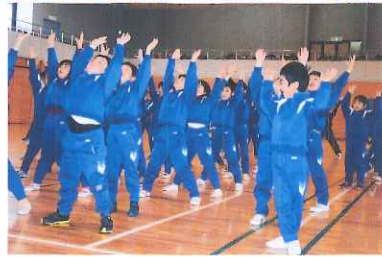
鵜飼地区学童保育クラブのみなさんです。