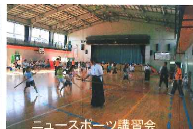
ニュースポーツ講習会