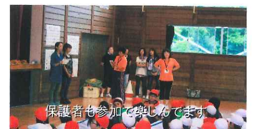
保護者も参加で楽しんでいます