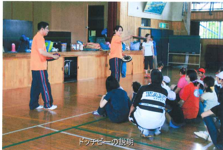
ドッチビーの説明