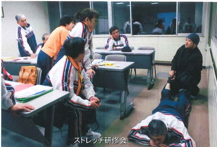
ストレッチ研修会