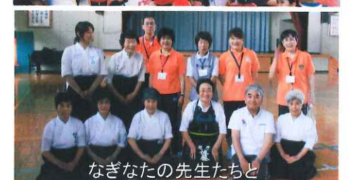
なぎなたの先生たちと