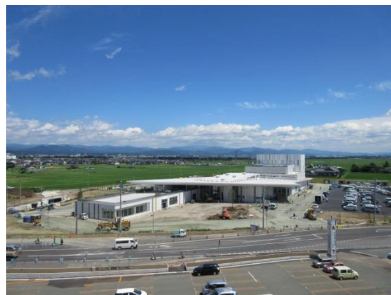
現在の建物の様子

現在 200 人以上の様々な職種の職人の方々が、施工管理者の指示及び現場監理者によるチェックのもと、作業が進められています。