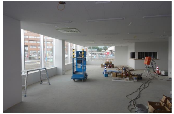
産業創造センター施工の状況