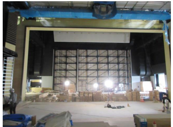
大ホール施工の状況

間もなく完成です。ROOF NEWS も次回が最終回。完成した姿をお伝えする予定としていますので、ぜひご期待下さい。