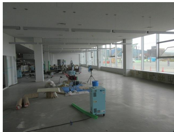
図書館内装施工の状況