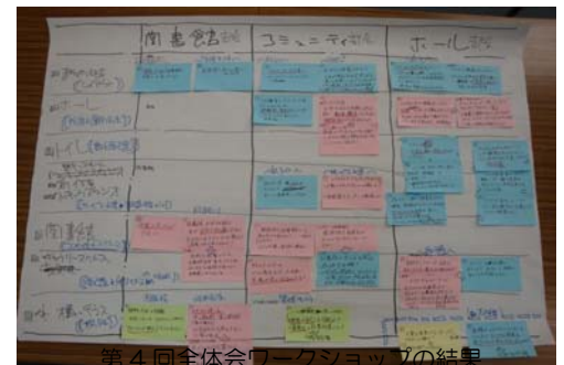
第4回全体会ワークショップの結果