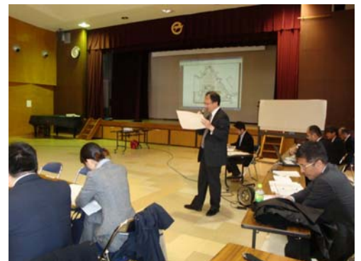
ワークショップの様子 （全体会・設計から説明）