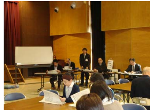
ワークショップの様子 （全体会・設計から説明）

K-8案は、これまで議論してきた内容をもとに、現実的な工事費用も勘案して作成したもので、予算上、要望があった一部の機能で実現が難しいものは、代替方法を議論しながら、検討を進めることになりました。最後に今後のスケジュールを説明すると共に、基本設計はK-8案で進めますが、引き続き案に対する意見を部会にて検討することを確認しました。