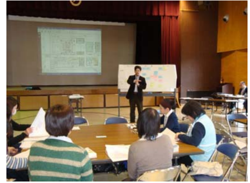
全体ワークショップの様子 (全体会)

今後ワークショップを通じ、建設費用も踏まえたK-8案をさらに改善していくこととなりましたが、その検討過程を今後も ROOF NEWS でお知らせしていきますので、よろしくお願いいたします。