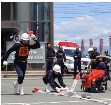
地域防災の担い手を募集します

随時受け付けています。地元消防団各分団か村防災防犯課消防担当（内線372）に申し込みください。