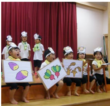
食育オペレッタを園児が発表します