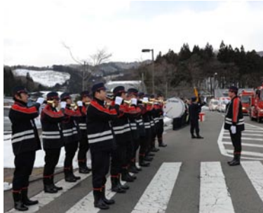
行進やラッパ隊の吹鳴を披露

防災防犯課消防担当（内線372） ※消防出初め式に先立ち、村交通指導隊の初出勤式も行われます。