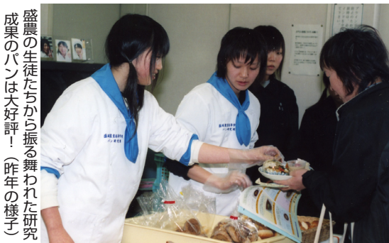
盛岡の生徒たちから振る舞われた研究成果のパンは大好評！（昨年の様子）

村では健康と食生活のかわりや農産物の生産者と消費者の交流を目的とした「食と健康のつどい」を開催します。健康に関する講演会のほか、地場産物を使った料理の試食などもあり、毎年好評です。特にお子さんを持つ保護者の皆さんに参加していただきたい内容です。託児もありませんので、お気軽にお申し込みください。皆さんの参加をお待ちしています。