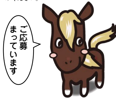
チャグチャグ馬コの里・滝沢村 PR推進員キャラクター「KOUHAKU」