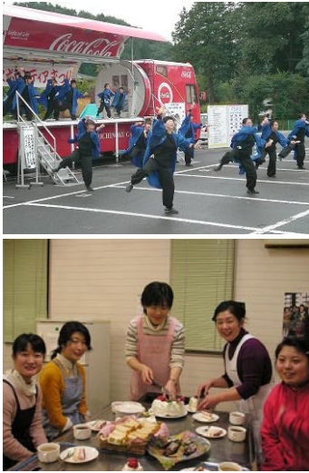
ホームではさまざまなクラブ活動を行っています