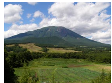
ふるさとへの思いを胸に